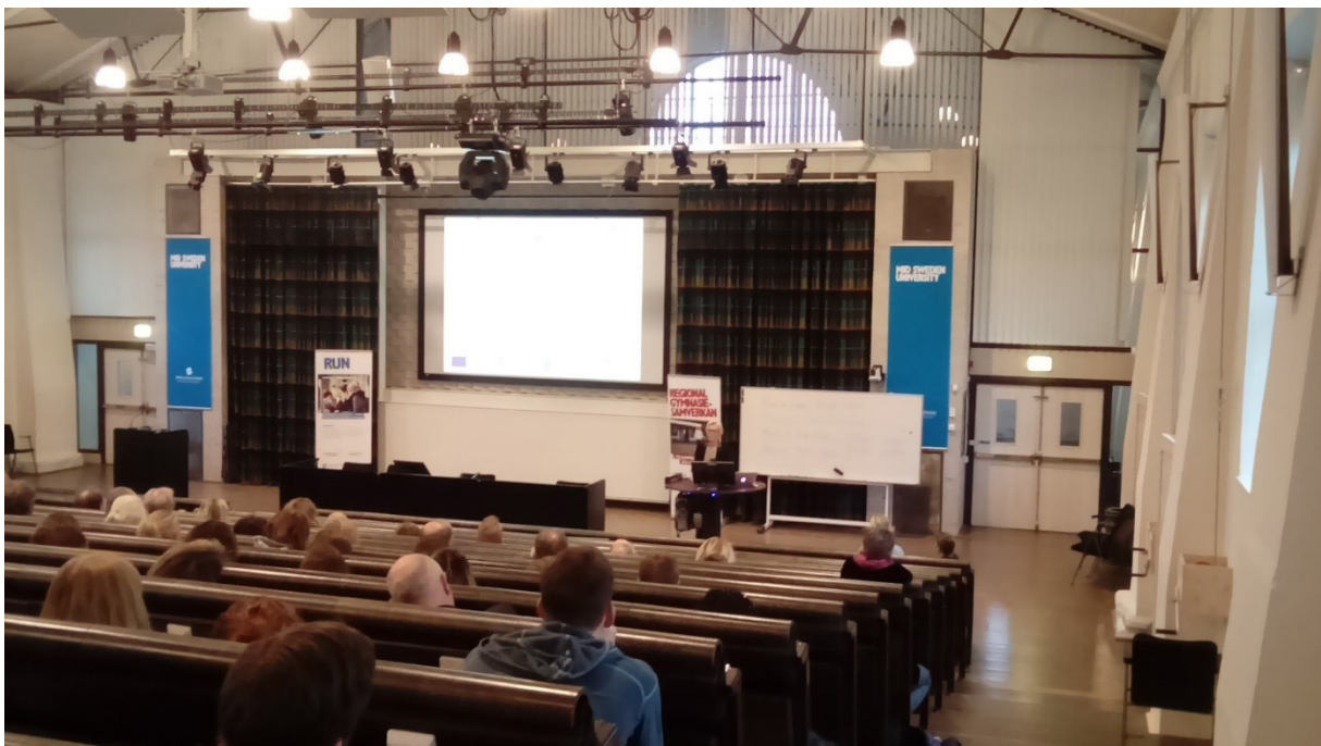
Bild från Fortbildningsdagen i Östersund 2016-10-31

Stor tack till alla Er: studenter, doktorander, lärare och forskare vid Mittuniversitetet, som medverkat på någon av aktiviteterna under 2016. Utan ert deltagande med era kunskaper skulle vi inte kunna bedriva någon samverkan.